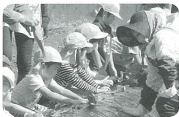
サツマイモ苗植え