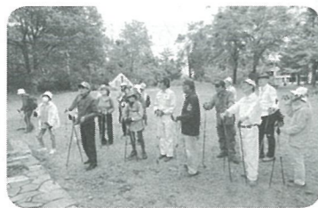
ノルディックウォーク教室