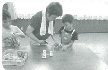
放課後子ども教室 ～工作～