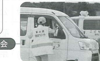
交通安全週間 ～梨 配布～