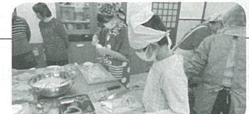
放課後子ども教室 ～おやつ作り～