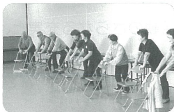
介護予防教室 ～健康体操～