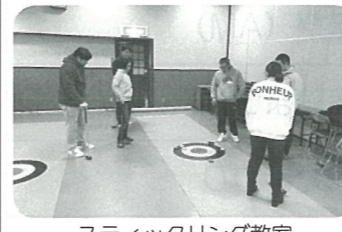
スティックリング教室