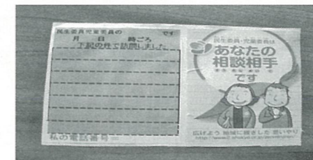
訪問相談連絡用紙(実施中)