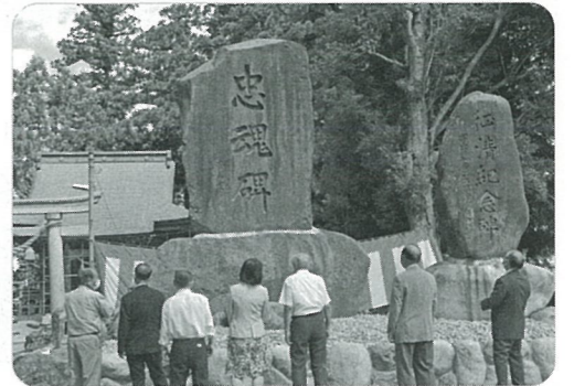
忠魂碑改修式典：2021年9月5日