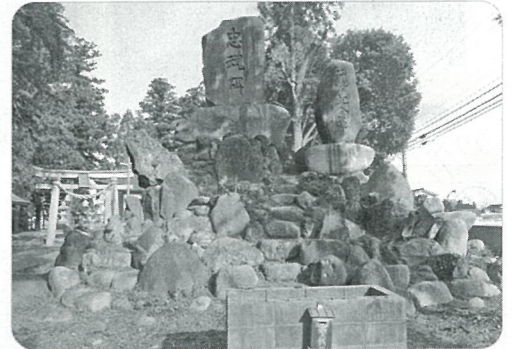
雑草・雑木撤去後：2020年12月撮影