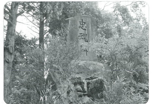
元の忠魂碑状態：2020年5月撮影

一方、2年前より忠魂碑を含め鳥居から南側のエリアを、振興会で維持管理することで取組んでいます。今後ともご理解とご協力の程宜しくお願い致します。