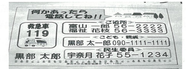
訪問相談連絡用紙(実施中)