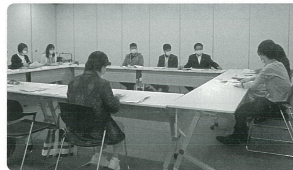
【福祉課との学習会】

荻生地区民生委員児童委員は一人暮らし、高齢者、災害時の避難行動支援、児童の見守り活動を地区住民の皆様と連携を密にした活動を行っていきたく思いますのでよろしくお願いいたします。