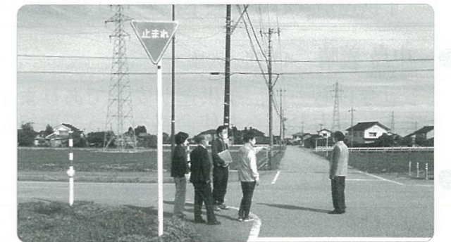
【通学路危険箇所点検】