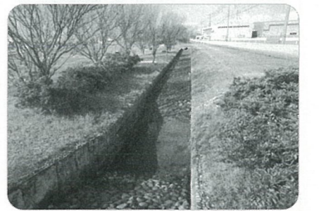
【水路泥除去&清掃後 (2022年)】

ベルトパークは、平成11年の完成から23年が経過しました。これまで十分な維持管理が進まず、水路は、土砂の堆積により雑草が繁茂。樹木は、巨木化し道路や遊歩道へのはみ出し等の弊害をもたらす、正常な公園状態でなくなりつつあります。これまで個々の要望もあり、適正な維持管理の必要性が求められています。