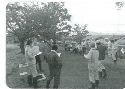
【作業前ミーティング】