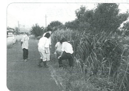
【水路内にカヤの繁茂 (2021年)】

ベルトパークは、平成11年の完成から23年が経過しました。これまで十分な維持管理が進まず、水路は、土砂の堆積により雑草が繁茂。樹木は、巨木化し道路や遊歩道へのはみ出し等の弊害をもたらす、正常な公園状態でなくなりつつあります。これまで個々の要望もあり、適正な維持管理の必要性が求められています。